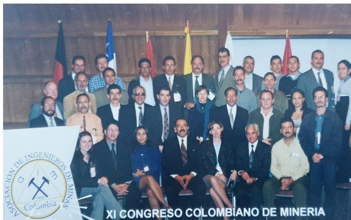
AIMC EN EL IX CONGRESO DE MINERÍA, 2000

los códigos de minas de la época, se dictaron múltiples cursos de capacitación en conceptos de tecnología de punta de la época. Se sirvió de conexión para la generación de oportunidades de empleo para los ingenieros de minas y demás profesionales de Ciencias de la Tierra.