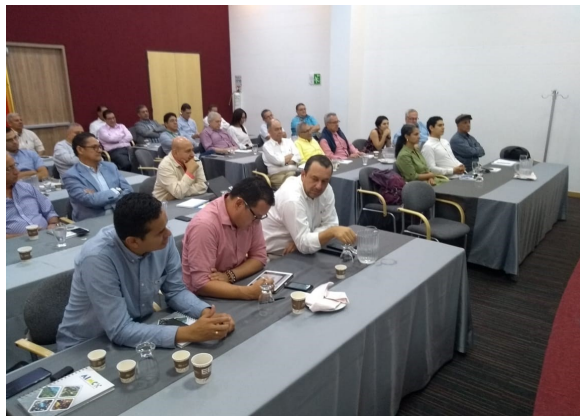
ASAMBLEA GENERAL ASOCIADOS AIMC—2020