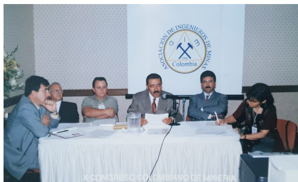
AIMC EN EL CONGRESO DE MINERÍA, 1998

Fue así como iniciamos el proceso ante la Cámara de Comercio de Medellín, en Julio 04 del año 1996, pagando un impuesto de Industria y Comercio de $ 19,700, argumentando como objetivos principales "Dar dinámica al gremio de profesionales de la Minería y para propender por un aprovechamiento racional e integral de los recursos minerales" .