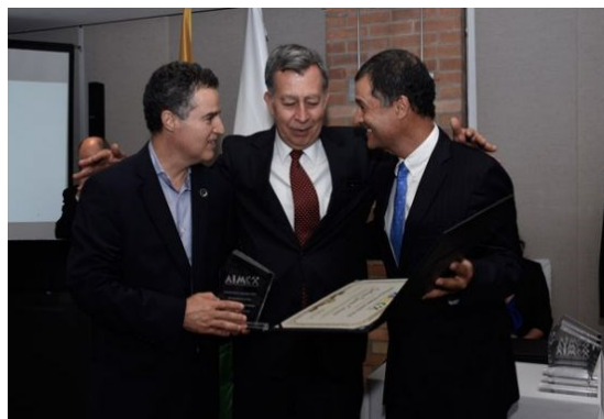
Minero Ejemplar, 2018

homenajeada con el RECONOCIMIENTO MINEROS EJEMPLARES, debe diligenciar el formulario de postulación diseñado para tal fin; el cual podrá solicitar al correo electrónico informacion.aimc@gmail.com